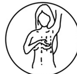
MOVIMENTOS PARA CIMA E PARA BAIXO