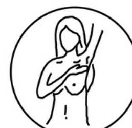
EXAMINE A AXILA